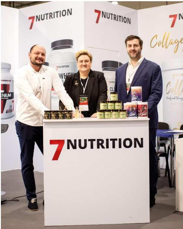
Źródło: Spółka 7FIT S.A.

W IV kwartale 2025 r. Spółka nabyła niezabudowaną nieruchomość gruntową o łącznej powierzchni 1,6133 ha za cenę 490 000,00 zł, położoną w miejscowości Stanowice, gmina Oława, powiat oławski, województwo dolnośląskie. Nieruchomość znajduje się w bezpośrednim sąsiedztwie obecnego zakładu produkcyjnego Spółki.