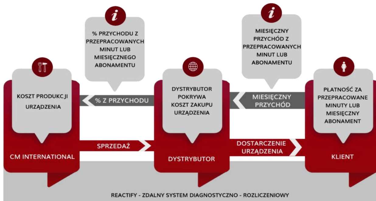
Schemat 1. Przykładowy proces monetyzacji świadczonych usług

W drodze dotychczasowej działalności Spółka wypracowała następujący schemat działania: