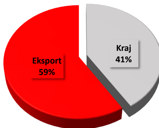
Geograficzna struktura sprzedaży ZMR S.A. w I kwartale 2026 roku

Struktura sprzedaży zaprezentowana na powyższym wykresie została przygotowana w ujęciu zarządczym i opiera się na geograficznym podziale ostatecznych konsumentów materiałów ogniotrwałych ZMR S.A.